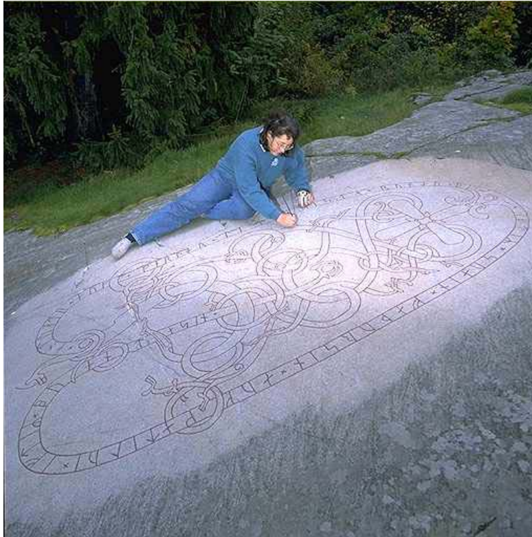
Runristningen U80, Foto: Bengt A. Lundberg, 1992. Från Riksantikvarieämbetets hemsida.

Enligt fornsök är ristningen också en del av ett mycket äldre gravfält som också inkluderar en gravhög och antalstensättningar. När Andvätt och Gärdar letade efter en plats att göra ett monument efter sin far på valde de alltså en plats som hade en lång tradition som en plats att hylla sina döda på, något de säkert var väl medvetna om. Platsen låg också vid en farled under denna tid. (Ahnlund 1953)