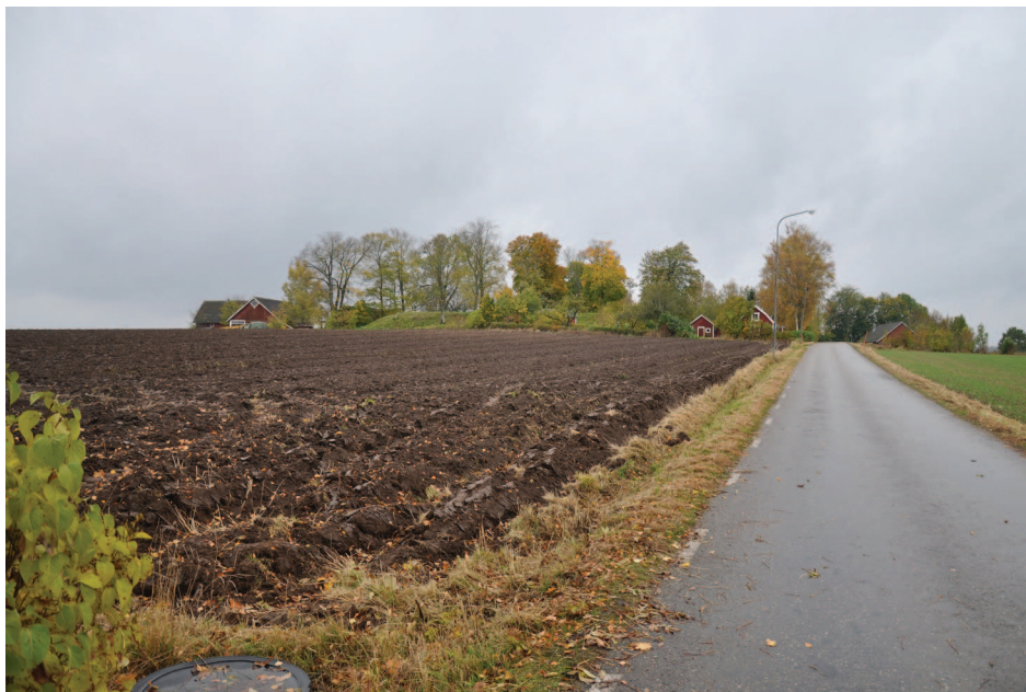
Fig. 1. Askahögen.

SHM - Statens Historiska Museum, Stockholm. Stenberg, A. D. 2006. Askahögen. En mäktig hallbyggnad i et östgötsk central-plassmiljö . Kandidatuppsats i arkeologi, Stockholms universitet 2006. Wahlberg, M. Svenskt ortnamnslexikon . Uppsala 2003. Westergard, B. 1992. Nytt fynd av romerska denarer i Halland. Svensk Numismatisk Tidskrift 1992:4-5, 110-113.