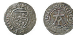
Fig. 5. Erik av Pommern, Västerås, örtug typ 1.

till att typerna 6 och 7 föregår typerna 4 och 5. I jämförelse med mynten präglade i Stockholm är de mynt av typ 6, präglade i Västerås mer naiva till utseendet. Holm lägger fram en teori om att dessa första typer skulle vara ett försök att starta en myntning i staden. Då den stora myntningen sedan kom igång bytte man till typerna 4 och 5. En anledning för Västeråsmyntningen, enligt Holm, är att det kan ha varit ett försök att täcka behovet av mynt inne i landet. Stadens myntning kan antas vara samtida med Stockholm typ 2, med tanke på de likartade sköldarna på åtsidan. Vidare fortsätter Holm med att föreslå troliga scenarion för