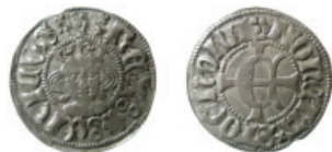
Fig. 2. Erik av Pommern, Stockholm, örtug typ 1.

Vid jämförelse med den tidigare dateringen av de olika typernas präglingsperioder och denna tabell över myntmästare kan man se att perioderna överensstämmer tämligen väl. Ett antagande kan således göras om en eventuell indelning av typer och myntmästare. I sådana fall skulle LL 1