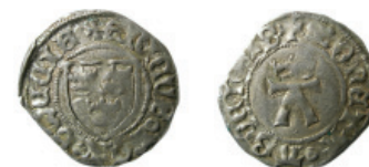
Fig. 9. Erik av Pommern, Åbo, örtug.

silver och en medelvikt på 0,27 g (Malmer 1980, 39).