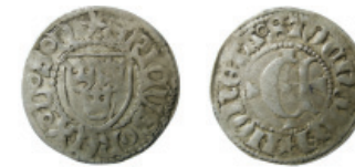
Fig. 4. Erik av Pommern, Stockholm, örtug typ 3.

Precis som under typ 1 delar Lagerqvist upp typ 2 i ankarformiga korsändar (LL 2a) resp. raka korsändar (LL 2b), d.v.s.