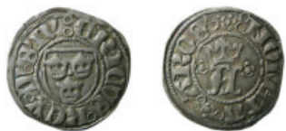
Fig. 8. Erik av Pommern, Västerås, örtug typ 4.

stilen är grov som under typ 1 med upprepningar eller felstavningar i inskriften (fig. 6). Halten visar en påtaglig försämring (medelhalt 73,6%) i jämförelse med typ 1 och örtugarna från Stockholm (tab. 8). Medelvikten (1,00 g) är också lägre. Det finns två stilvarianter med snett (LL 6a) resp. horisontellt tvärstreck (LL 6b) i fransidans krönte A. Åtta ex. av varianten LL 6a har en medelhalt av 74,71 mot 70,58 för tre ex. av LL 6b. Medelvikten för 6a är däremot bara marginellt högre än för LL 6b. Det bör emellertid noteras att det bara ingår tre ex. av LL 6b och resultatet kanske hade blivit annorlunda med ett större antal.