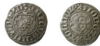
Fig. 3. Erik av Pommern, Stockholm, örtug typ 2.

indelas i en äldre och yngre fas med en fas som sannolikt ligger däremellan. I det här undersökta materialet finns en tendens att varianten LL 1b ligger i den äldsta fasen och att halten är högre. På motsvarande sätt finns en tendens att LL 1a ligger i den sena fasen och att halten är lägre. Om varianterna och stilarna har en kronologisk betydelse, vilket förefaller sannolikt så skulle överlappningen i så fall kunna beror på en övergångsfas då både varianterna och stilarna blandades. Det är däremot svårare att se att halterna kan kopplas till olika kronologiska faser. Det finns ingens tendens