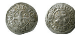
Fig. 10. Erik av Pommern, Åbo, abo typ 1.

Västeråsmyntningen försökte särskilja varje enskild stamp på ett tydligt sätt, och den tillhör därför förmodligen samma tid som Stockholm LL 2 där det finns en mångfald initial- och interpunktionstecken" (Holm 2006).