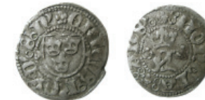
Fig. 7. Erik av Pommern, Västerås, örtug typ 3.