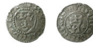
Fig. 6. Erik av Pommern, Västerås, örtug typ 2.