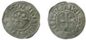
Fig. 13. Kristofer av Bayern, sterling (Galster 19).