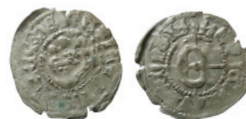
Fig. 10. Erik av Pommern, gros (Galster 13).

mellan motivets tassar, något som saknas på de som präglades i Lund.