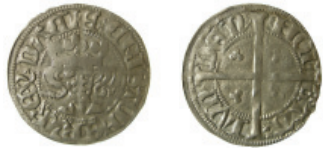
Fig. 12. Kristofer av Bayern, søsling (Galster 17).