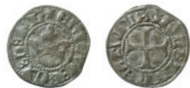
Fig. 4. Erik av Pommern, sterling (Galster 4).

Den tredje myntningsperioden avser kopparsterlingar från Næstved (Galster 7), Lund (Galster 10), Odense (Galster 14) och Randers (Galster 15), vilka daterats med hjälp av skriftliga källor till ca 1422 (fig. 7). Myntningen kan ha skett ca 1420-1424 för att sedan återupptas ca 1425-1430/35 eller pågått ännu längre (Moesgaard 2005, 81-82). Dessa mynt består nästan av ren koppar och genom denna myntning sökte kung Erik att finansiera en tilltänkt utlandsresa till bl.a. Jerusalem. När tillräckligt med medel samlats in för att täcka reskostnaderna för kung Erik iväg, varpå han lämnade drottning Filippa att styra landet i sin frånvaro. Kopparsterlingen ogillades av både bon-