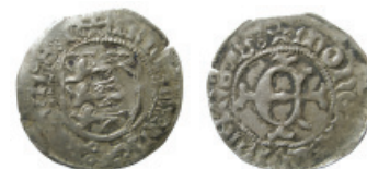
Fig. 8. Erik av Pommern, søsling (Galster 11).