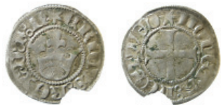
Fig. 2. Erik av Pommern, hvid (Galster 2).

ett kors på frånsidan med omskrifterna; "MONETA NESTWED" eller "MONETA LUNDENSIS", mynt från Næstved (Galster 4) respektive Lund (Galster 9). Sterlingarna från Næstved har en stjärna mellan "ERICVS" och "DSN" medan valören från Lund har ros, treklöver eller kors. Dessa tecken kan ha varit medvetna för att indikera olika skillnader (Moesgaard 2005, 79). Stefke har föreslagit att myntningen flyttades från Næstved till Lund 1412/13 (Stefke 1995, 162). Under den andra myntningsperioden präglades även penningar (Galster 5) i Næstved och Lund, och halvpenningar (Galster 6) i Næstved (fig. 6).