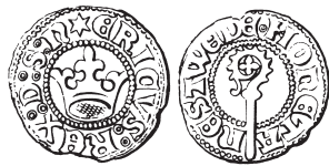
Fig. 3. Erik av Pommern, hvid (Galster 3).

debefolkningen och handelsmännen, som vägrade att handla med den.