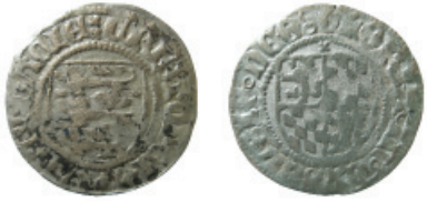
Fig. 11. Kristofer av Bayern, skilling (Galster 18).