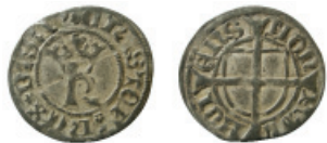
Fig. 14. Kristofer av Bayern, hvid (Galster 20).

och omskriften "CRISTOFER D G REX DACIE" (Kristofer, med Guds nåde kung av Danmark). På frånsidan finns Kristofers personliga bayerska vapen och omskriften "GLORIA IN EXSELSIS DEO" ("ära vare Gud i höjden").