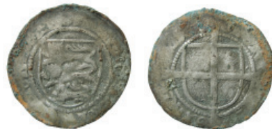
Fig. 15. Riksrådet 1448, skilling (Galster 21).

Skillingarna har på åtsidan det danska riksvapnets lejonmotiv och omskriften "MONETA REGNI DACIE". Frånsidan