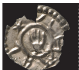
Figur IV. Ulf Fases hand.