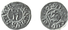
Figur VI. Nils Bosson Stures mynt.