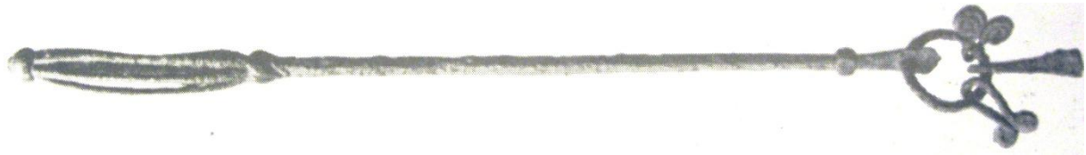
Staven från Gävle.

hållit en läderrem. Liknande fynd från både Finland och Sverige ger ingen säkerhet i att de tolkats korrekt, Price syftar på en alternativ magisk funktion. Likheterna med stavarna är slående och de rasslande lösdelarna kan kopplas till såväl hästar som någon magisk funktion. Enligt Price kan objektet från Gävle vara en stav, vars utförande lämnar ännu en förbryllande dimension. Ofta saknas sista delen av stavarna när de påträffas och vem vet hur de avslutats, även om de sannolikt bara avsmalnade varför man ej funnit mer av dessa partier. (Price 2002:189).